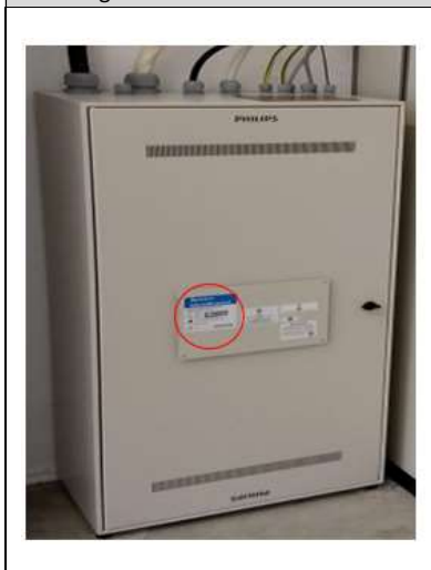
Figura 3. Localizare etichetă